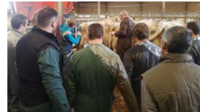
Formation échographie dans la Nièvre